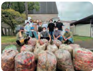
三神支部は雨の中清掃活動