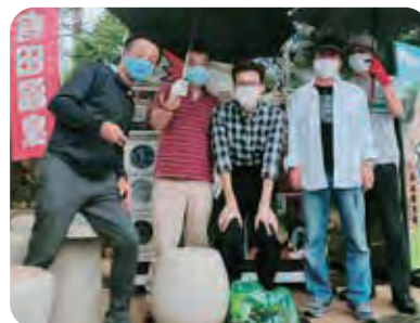
伊万里有田支部は、伊万里地区で伊万里公園除草作業 有田地区で有田駅前広場清掃作業