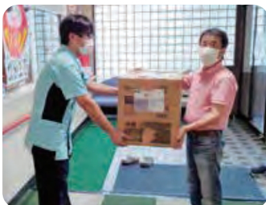
鹿島支部は施設へ古タオルの贈呈